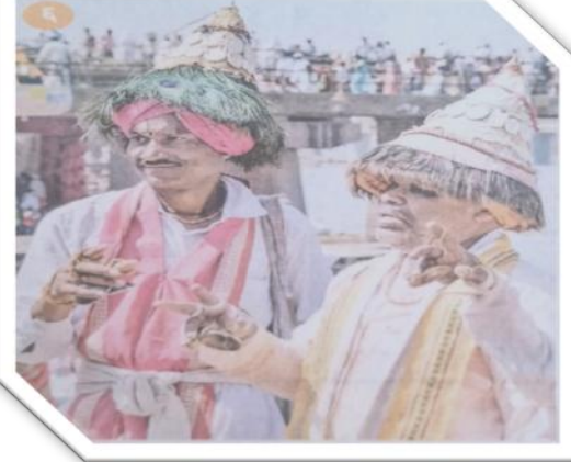
आळंदीतील वासुदेव भेट