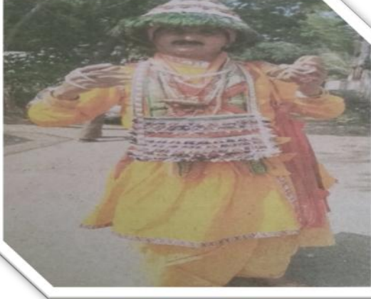
भोसरी- वासुदेवाचा लोककलाविष्कार