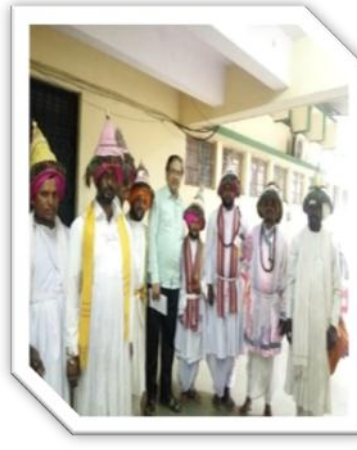
वासुदेवांसमवेत प्रस्तुत अभ्यासक